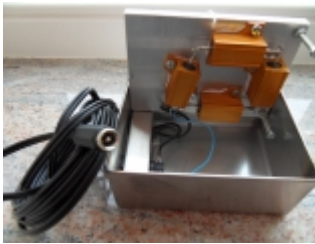
Onderbak met weerstanden