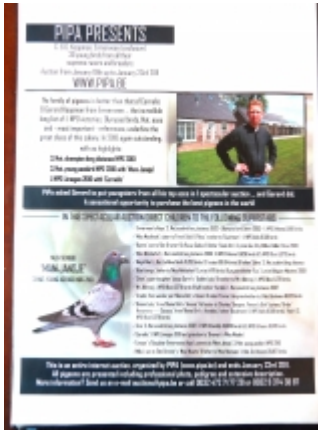
Aankondiging verkoop Pipa