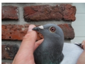
2e duif Breuil le Vert

9,11,12,55,57,58,61,62,63,65,71,75,77,80,82,83,87 en 91