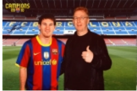
Gerard tegen Messi: "Begin toch met duiven jonge"