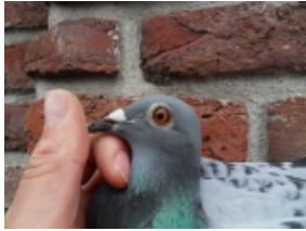
3e duif Breuil le Vert

De afdeling 10 start met zo'n 30.000 duiven op de eerste vlucht en telt zo'n 2000 leden.