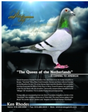
Queen of the Netherlands, nu bij Kenny Rhodes USA

De eerste npo vlucht alweer. Dit maal werd er gevlogen vanuit het Noord Franse Breuil le Vert, een kilometer of 40 ten Noorden van Parijs. Al met al een afstand van 486 km naar Ermerveen. Om 09.30 werden de duiven gelost en al om 15.13.52 kon de eerste duif geklokt worden, de eerste duiven volgden elkaar in rap tempo op en exact 60 sec. later zaten er 5 in de klok, al deze duiven zijn duivin.