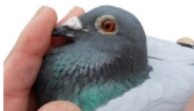
Blasco, 1e vit. duif afd. 10

De hele voorbereiding liep op een natuurlijke manier en de koppels mochten hun eigen jongen grootbrengen. Hierdoor zaten alle vliegers eind februari "los" In grote lijn is wel geprobeerd om de duivinnen niet te laten herleggen, door 1 van de partners op tijd eraf te doen kon dit in de meeste gevallen worden voorkomen. Ze hebben vanaf deze tijd volop gelegenheid gehad om zich 1 maal per dag in conditie te trainen. De voeding in deze fase is aangepast, meestal wordt pas volledig overgeschakeld naar uitsluitend All In One Mengeling vanaf 14 dagen voor de 1e npo vlucht. Voor het volledige voederschema, klik op de volgende link: www.gerardkoopman.com/48/voederschema-all-in-one.html